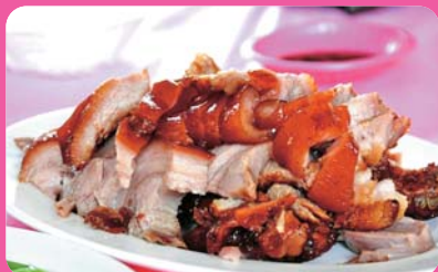
萬崙豬腳 (離迦南 11 公里)