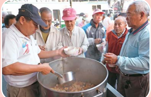
千人尾牙關懷弱勢鄉民 預計105年1月23日迎春送暖