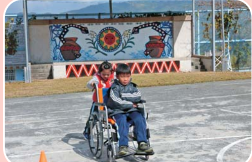
與偏遠國小合辦 身心障礙體驗活動