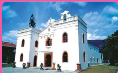
萬金聖母聖殿 (離迦南 9 公里)