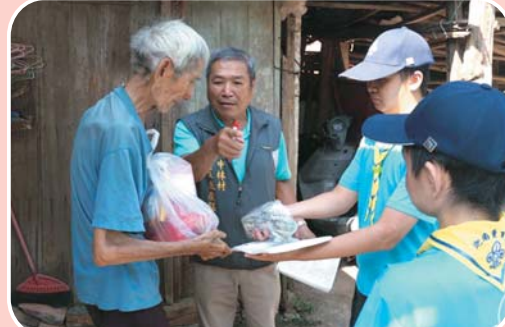
端午送好呷的愛心 獨居老人足感心