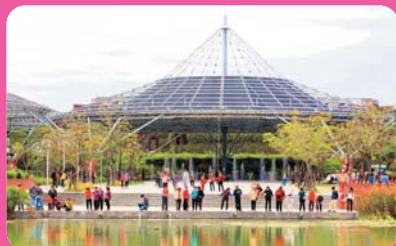
六堆客家文化園區 (離迦南 7 公里)