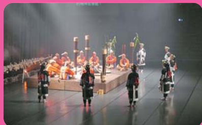
台灣原住民文化園區 (離迦南 11 公里)