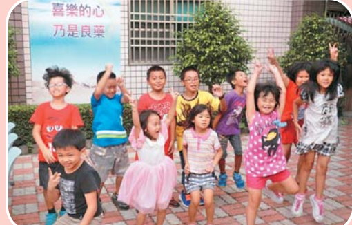
弱勢兒童課輔與夏令營 助學童有愛無礙